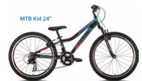
MTB Kid 24"