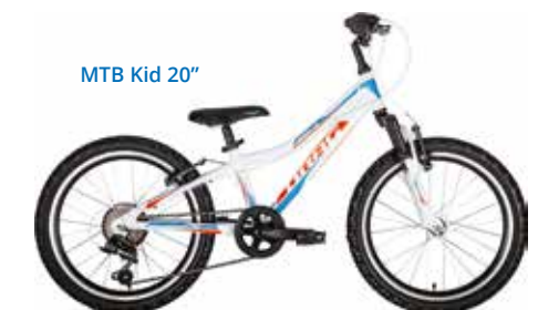
MTB Kid 20"